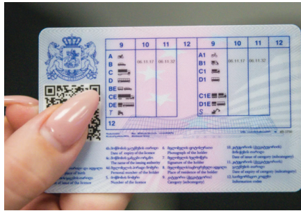
Согласно данным на сайте МВД, только в период с 1 января по 30 сентября баллы

С 2017 года в Грузии действует особая система: на водительские права 1 января ежегодно начисляются 100 баллов, которые сокращаются по мере совершения нарушений. По истечении лимита автомобилисты лишаются прав. После этого они должны либо заново сдавать на права, либо ждать год.